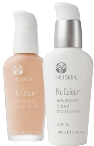
1 NU COLOUR® SPF 15 防晒护肤妆前修饰乳液

派对季节近在眼前，您忙着奔波于购物商场采购圣诞饰品与礼品，确保家中布置充满佳节气氛，最后往往只剩下少许的时间打理自己的仪容。无论您是主人家或是出席老朋友的聚会，您都希望呈现最棒的自己!