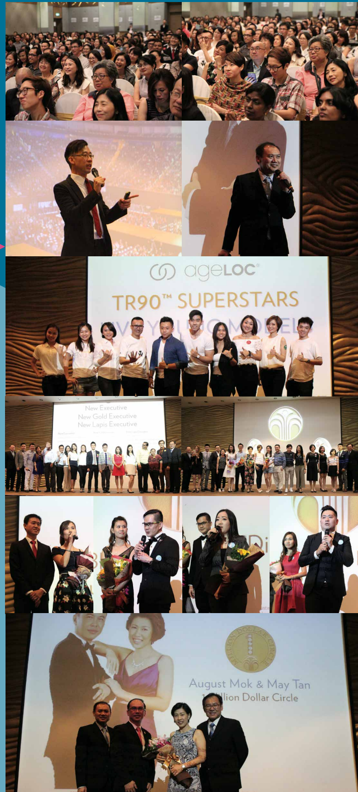
▼成功庆典 2016年10月7日 Parkroyal Hotel KL