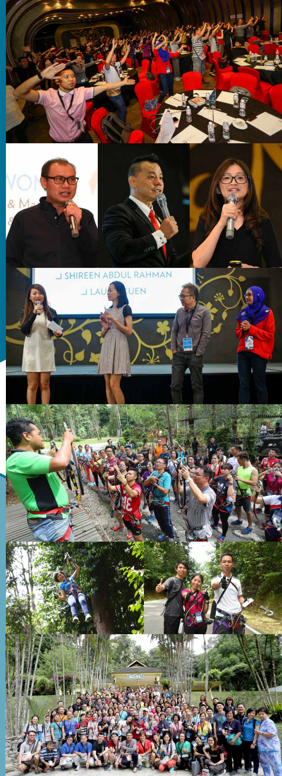
▼新星学营 2016年10月20日至21日 Empire Hotel Subang