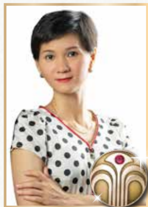
ELVI New Executive Brand Partner

Platform dan skema kompensasi bisnis yang jelas dan menarik menjadi alasan saya untuk fokus dan total menjalankan bisnis Nu Skin yang bisa membantu saya mendapatkan perubahan hidup, baik dalam hal kesehatan dan juga finansial.