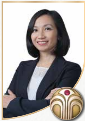
SHIENNY New Executive Brand Partner

Saya merasa Nu Skin adalah platform yang sesuai untuk mencapai goal saya. Dari produk, sistem pendukung dan upline semua berkolaborasi dengan baik memandu saya. Saya terus berjuang untuk menjadi Executive Brand Partner karena saya ingin membantu orang tua saya. Saya yakin dengan ketekunan, usaha keras dan fokus dalam menjalankan bisnis Nu Skin, saya bisa mencapai mimpi saya.