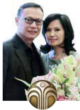
Febi Kariko Diamond Executive