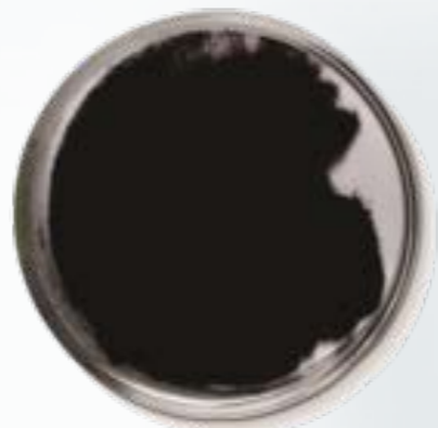
アスタキサンチン