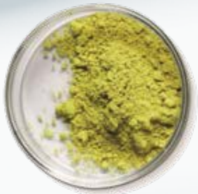
柑橘系バイオフィラボノイド