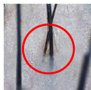
古い角質や皮脂に阻まれ、成分が届きにくい状態

有効成分が広く頭皮を清浄し、ナノサイズ化された髪に大切な成分が、深く浸透します。このダブルの働きが「クリーンアップ デリバリー システム」です。