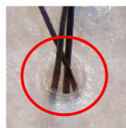
毛穴・頭皮から成分が浸透しやすい状態