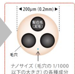
毛穴とナノサイズの大きさイメージ