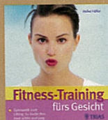
Buch: „Fitness-Training fürs Gesicht“, Trias Verlag, ca. 15 €