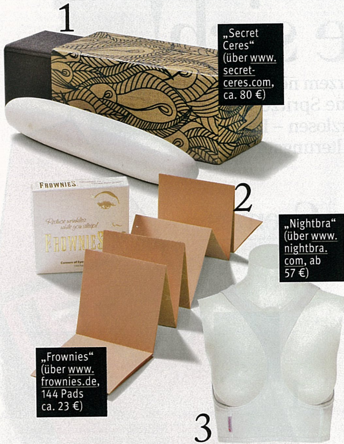
„Secret Ceres“ (über www.secretceres.com , ca. 80 €)

IM NAMEN DER SCHÖNHEIT IST UNS JEDES MITTEL RECHT. UNSERE TOP FIVE DER SKURRILITÄTEN: