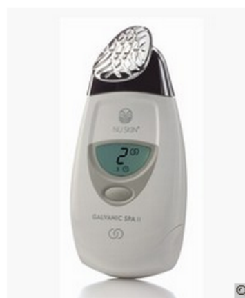
AgeLOC® Edition Nu Skin Galvanic Spa System™ II

AgeLOC Nu Skin Galvanic Spa System™ II: 352 € aprox Para más información: www.nuskin.com