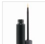
Pestañas cada vez más largas