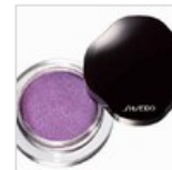
Luz en la mirada