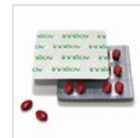
Belleza en cápsulas