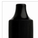
¡Maquillaje a prueba de agua!