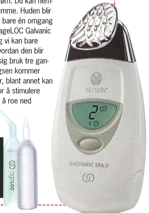
ageLOC Galvanic Spa System, kr 2945, boks med behandlingsgelé, kr 439

«There is only one Mademoiselle in this world, and that is I, one Madame and that is Rubinstein, and one Miss and that is Arden.»