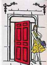
Elizabeth Arden Limited Edition Anniversary Lipstick Rouge à lèvres d'anniversaire d'édition limitée