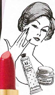
Elizabeth Arden Limited Edition Anniversary Lipstick, kr 220