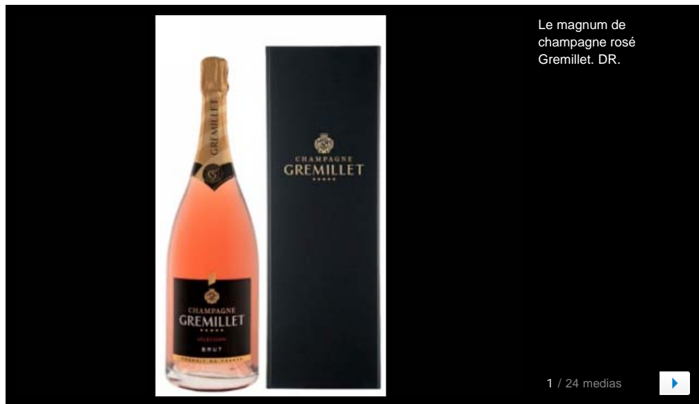
Le magnum de champagne rosé Gremillet.