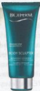
Body Sculpter alakformáló gél, Biotherm, 11 500 Ft