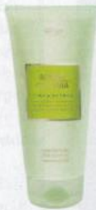
Aqua Colonia Lime & Nütneg hidratáló testápoló, 4050 Ft