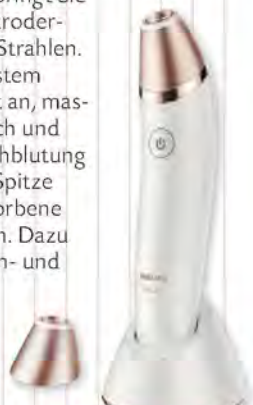
LEUCHTKRAFT „VisaCare SC6240/01“, Philips, ca. 249 €

Der „VisaCare“ bringt Sie mithilfe von Mikrodermabrasion zum Strahlen. Das Vakuum-System „saugt“ die Haut an, massiert sie zusätzlich und regt so die Durchblutung an. Die Peeling-Spitze entfernt abgestorbene Hautschüppchen. Dazu wird die Kollagen- und Elastin-Produktion angeregt. Zweimal pro Woche anwenden.