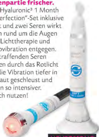
LICHTGESTALT „Hyaluronic 3 1 Month Eye Perfection“-Set, Ètre Belle Cosmetics, ca. 89 €

Das „Hyaluronic 3 1 Month Eye Perfection“-Set inklusive Gerät und zwei Seren wirkt Linien rund um die Augen dank Lichttherapie und Mikrovibration entgegen. Die straffenden Seren werden durch das Rotlicht und die Vibration tiefer in die Haut geschleust und wirken so intensiver. Täglich nutzen!