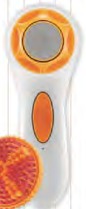
FLOTTE SOHLE „Clarisonic PEDI“ mit Peeling-Bürstenkopf, Clarisonic, ca. 200 €

An die Füße, fertig, los! Das Pediküre-Gerät arbeitet wie ein sehr effektiver Ultraschall-Bimsstein und entfernt mit oszillierenden Bewegungen überflüssige Hornhaut – ganz ohne Anstrengung. Die Füße fühlen sich hinterher samtweich an. Der passende Peeling-Aufsatz und Pflege-Produkte runden die Home-Pediküre ab.