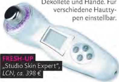
FRESH-UP „Studio Skin Expert“, LCN, ca. 398 €

Das Multifunktionsgerät vereint Elemente aus der Ultraschall- und Lichttherapie sowie galvanischen Strom (fördert u. a. die Durchblutung) – und sorgt dafür, dass jedes Pflegeprodukt in tieferen Hautschichten einwirken kann. Die Texturen am besten sanft kreisend einmassieren. Die Haut wirkt sofort rosiger und glatter. Ideal z. B. für Gesicht, Dekolleté und Hände. Für verschiedene Hauttypen einstellbar.