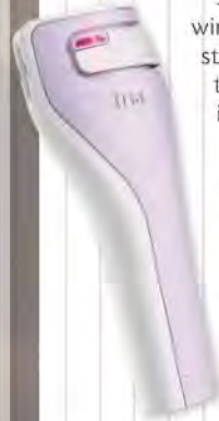
STRUKTURGEBEND „Age-Defying Laser“, Tria, ca. 495 € (über Douglas)

Der „Age-Defying Laser“ funktioniert mit der sogenannten Fraxel-Laser-Technik, die auch bei professionellen Treatments genutzt wird und als besonders präzise gilt. Dabei wird die Kollagenproduktion stimuliert, die Gesichtskonturen (z. B. am Kinn) sollen innerhalb von zwei Monaten straffer aussehen. Tipp: Laser für zu Hause – gerade fürs Gesicht – nicht zu hoch einstellen.