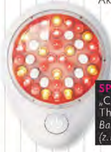
SPOT ON „Clear Rayz Light Therapy for Acne“, Baby Quasar, ca. 249 € (z. B. Amazon.de)

Das spezielle Treatment soll die Haut besser in Balance bringen: Blaue Lichtwellen wirken Aknebakterien entgegen, rote stoppen Entzündungen. Das farblich wechselnde Licht dafür alle zwei Tage vors Gesicht halten – nicht zu nah, um Rötungen und Reizungen zu vermeiden. Wichtig: die unterstützende Akne-Therapie vorab mit dem Hautarzt besprechen.