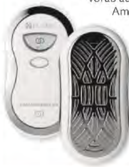
STROMQUELLE „AgeLOC Galvanic Body Spa“ (inklusive 2 Cremes), Nu Skin, ca. 470 €