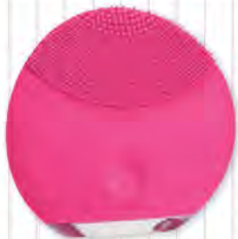
ALLES KLAR „Luna Mini“ in verschiedenen Farben, Foreo, ca. 119 €

Die süßen, kugeligen „Foreo Luna“-Gesichtereinigungsgeräte (etwa so groß wie eine Handfläche) mit Mini-Silikon-Noppen gleiten pulsierend über die Haut und entfernen so effektiv Schmutz, Talg und Make-up-Reste. Der Teint wird verfeinert und wirkt frischer. Für jeden Hauttyp erhaltlich und dank der kompakten Größe auch für Reisen praktisch.