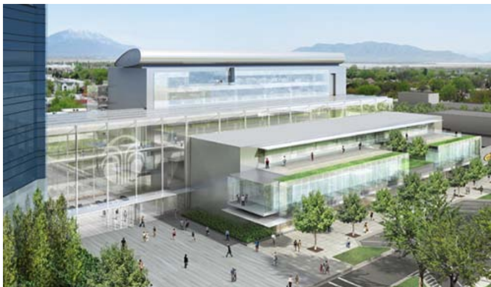
A Nu Skin kutatási és fejlesztési központja Utah államban

A TR90-ről a Rúzs-on részletesen is beszámolunk nemsokára.