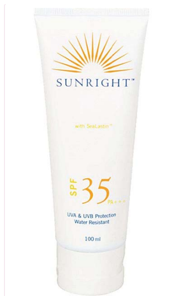
Sunright® SPF 35

Taktiež poskytuje širokospektrálnu ochranu pred UVA, UVB a infračerveným žiarením. Vďaka špeciálnej zmesi proteínov účinkuje presne v tom čase, keď ho najviac potrebujete. Pokožku zároveň chráni pred poškodením a preťažením, zabezpečuje tiež optimálne bunkové zdravie. Obsahuje tiež výťažky z mäty priepornej, aby nebola pleť podráždená. Cena za 100 ml balenie je 23,20 €. Používať sa môže na tvár a telo.