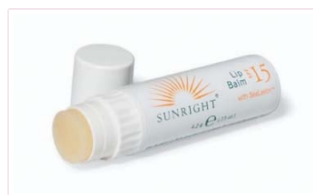
Sunright® lip Balm SPF 15

Morský lastín získaný z hnedých rias zvyšuje obnovu kolagénu a elastínu. Vitamín E pôsobí práve proti slnečnému žiareniu a chráni ich pred vonkajšími vplyvmi a vďaka slnečnicovému oleju sú pery hydratované a jemnejšie. Balzam od Nu Skin stojí 11,15 €.