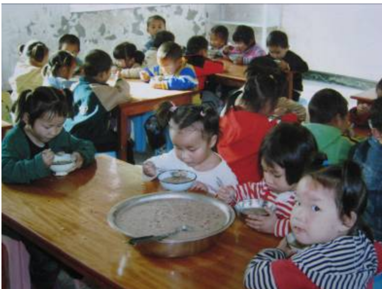
Copii din Ținutul Jiange Grădinița Xiasi Caizhi mâncând VitaMeal

Examinarea sănătății sale de anul trecut a arătat că „suferă de anemie iar creșterea sa este lentă”. După ce a consumat VitaMeal pentru o vreme, a devenit plină de energie, simpatcă și activă. Culoarea feței sale a devenit radiantă”.