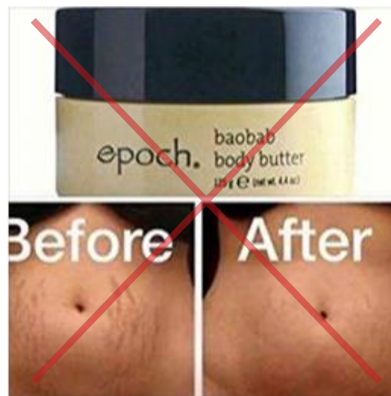
Se muestran reclamos de productos no autorizados.