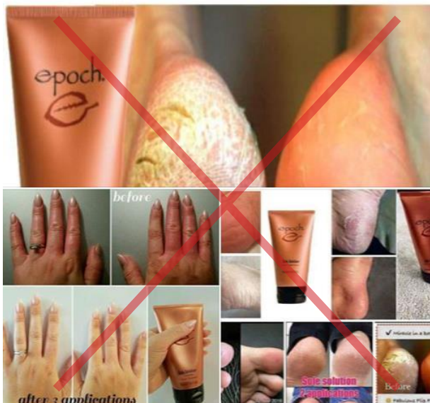
Se muestran reclamos de productos no autorizados.