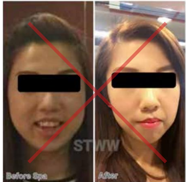
Konsistens er ikke gældende. Belysning, vinkel og makeup er forskellig.