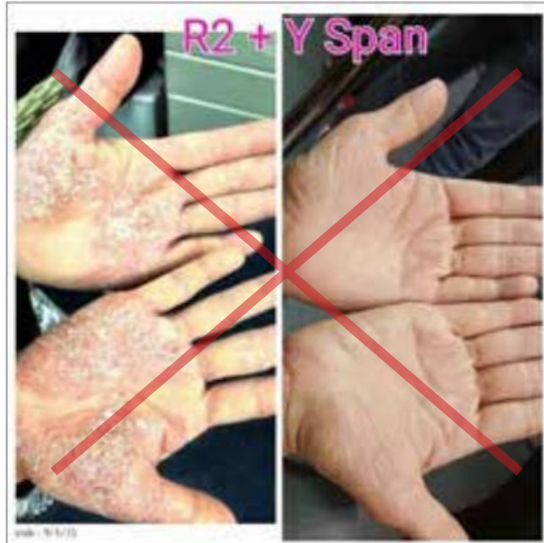
Uautoriserede medicinske påstande og vilkår vises.