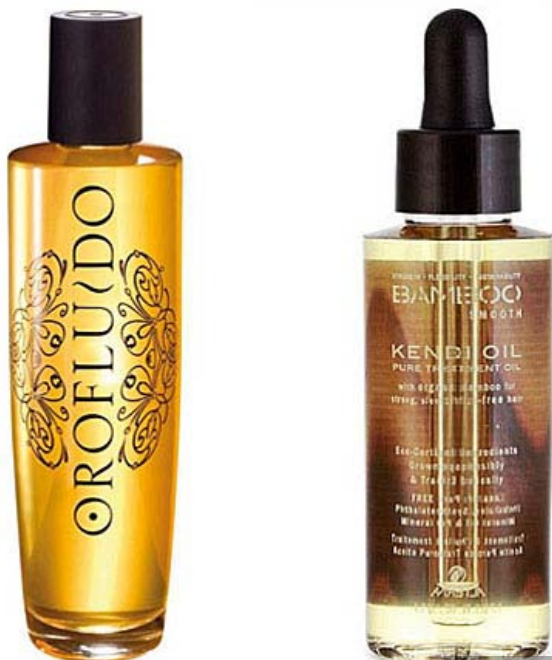
Na foto (zleva): Orofluido Revlon 259 Kč, Bamboo Smooth Kendi Oil Alterna 595 Kč