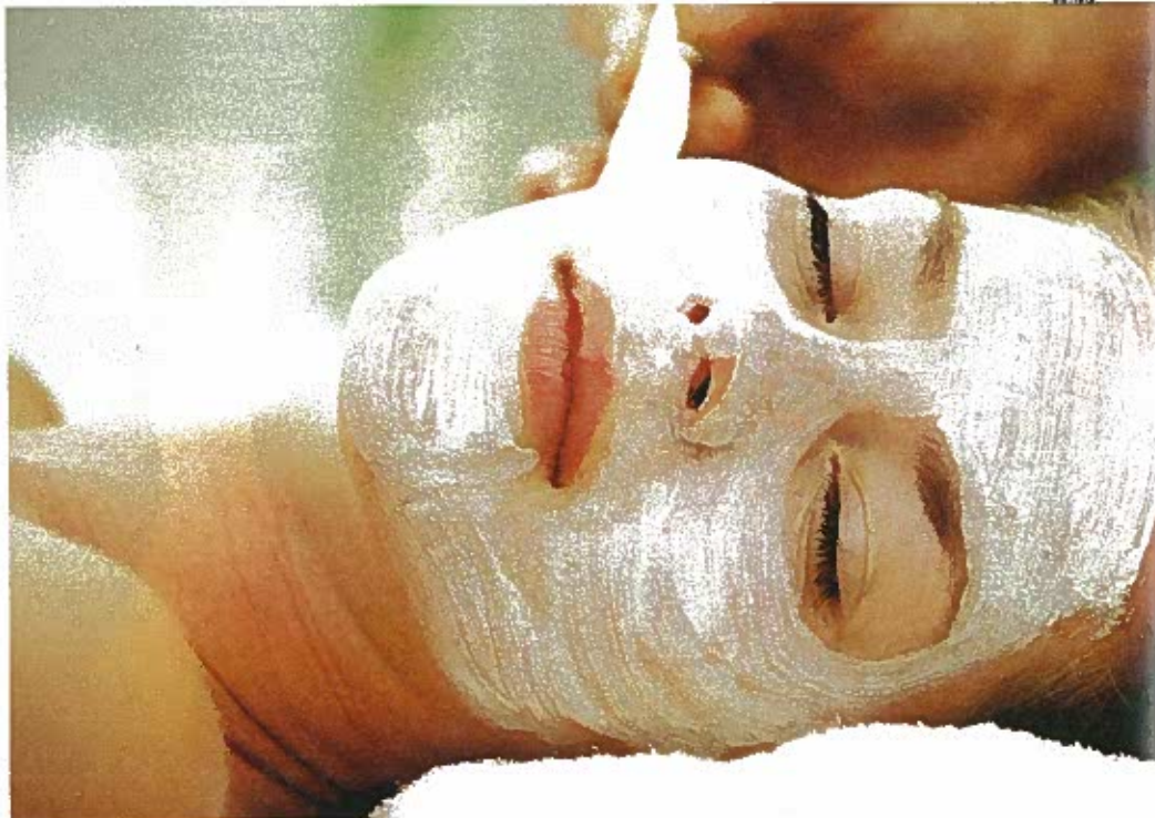
Productie en tekst: Laura de Coninck. Foto's producten: Yves de Lobelle. Shopping: Katleen Lison.

Hier krijg je een therapeutische lichaams-scrub gevolgd door een warme zeemoderpakking met aangepaste aromatische oliën. Deze behandeling maakt de huid zacht en ontspant pijnlijke spieren.