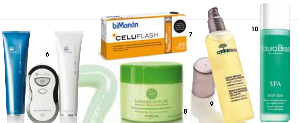
6. Nu Skin 'Galvanic Body Spa' (352,01 €), con tecnología pulsada. 7. BiManán 'Celu Flash' (45 €). 8. Maystar 'Crema Anticelulítica Reductora' (45 €). 9. Nuxe 'Huile Minceur Cellulite Infiltrée' (26,90 €), con efecto reductor. 10. Natura Bissé 'Spa Body Slim', a base de algas.

En qué consiste Se utiliza el novedoso equipo Venus Freeze, que combina pulsos magnéticos y radiofrecuencia multipolar para eliminar efectivamente los adipocitos. Se completa con electroporación para vehicular profundamente activos lipolíticos, drenantes y reafirmantes y con infiltraciones tensoras. Para qué Trata, al tiempo, celulitis, flacidez y falta de elasticidad. Precio Desde 170 €. Dónde Institut Saurina, Barcelona, tel. 934 19 51 15, institutsaurina.es.