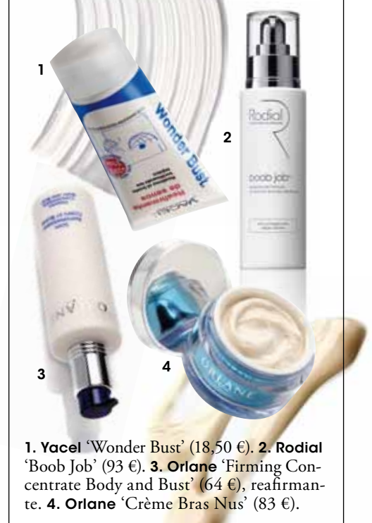
1. Yacel 'Wonder Bust' (18,50 €). 2. Rodial 'Boob Job' (93 €). 3. Orlane 'Firming Concentrate Body and Bust' (64 €), reafirmante. 4. Orlane 'Crème Bras Nus' (83 €).