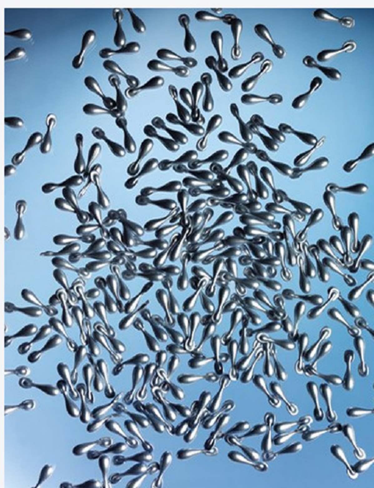
Viên sản phẩm.

Ethocyn là thương hiệu đã được đăng ký với thành phần được phát triển bởi Chantal Burnison và sản xuất bởi Công ty Dược phẩm BCS cho tập đoàn Nu Skin.