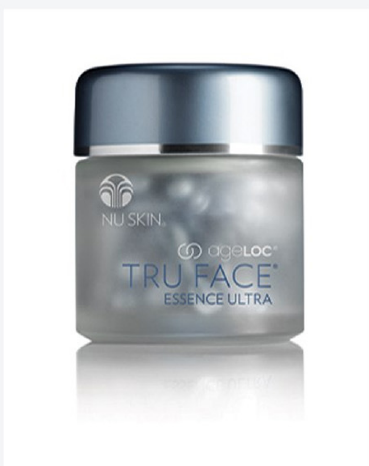
Sản phẩm ageLOC Tru Face Essence Ultra.

Với tinh chất làm săn chắc da ageLOC Tru Face Essence Ultra, bạn có thể làm chậm lại tiến trình lão hóa da và giữ mãi nét đẹp tuổi thanh xuân. Sản phẩm được phát triển theo công thức đặc biệt dựa vào sức mạnh của Ethocyn, công nghệ chống lão hóa mang tính đột phá, tập trung vào nguồn gốc gây ra lão hóa làm mất sự săn chắc da.