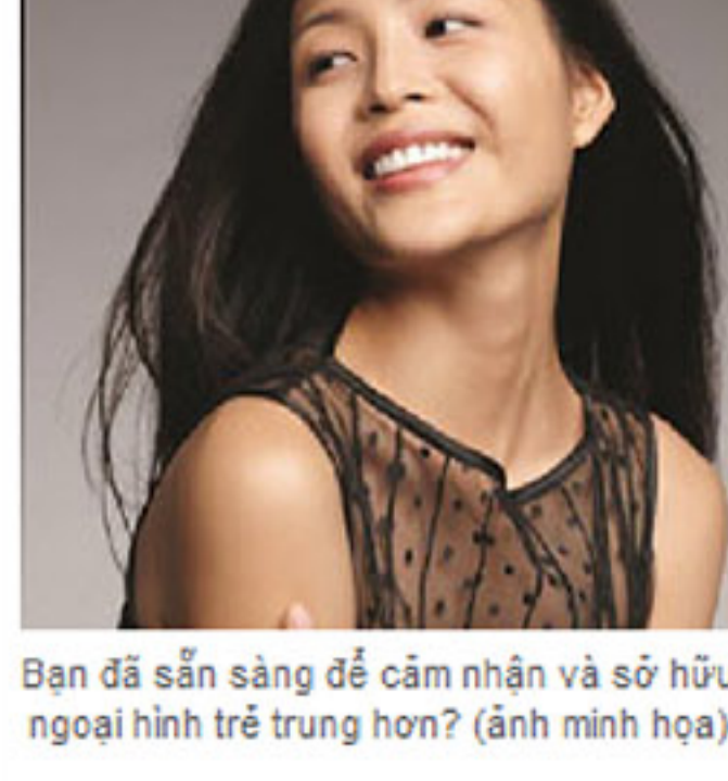
Bạn đã sẵn sàng để cảm nhận và sở hữu ngoại hình trẻ trung hơn? (ảnh minh họa)