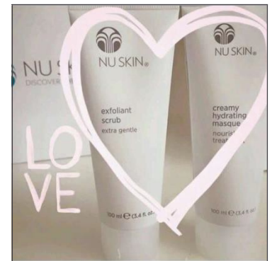
Nu Skin 產品呵護您的肌膚！