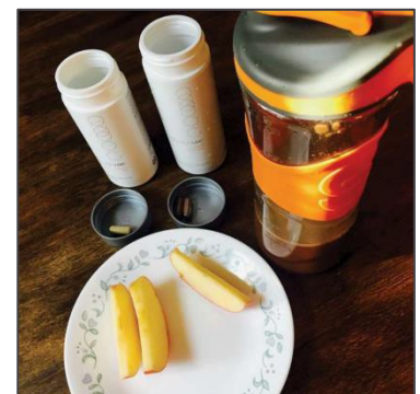
早安！今天起床梳洗後，聽聽我們的講解吧！