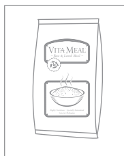
Nu Skin® vervaardigt VitaMeal

Omdat donateurs een product doneren en geen geld , weten ze hoe hun donatie wordt gebruikt en dat deze het leven van kinderen verbetert.