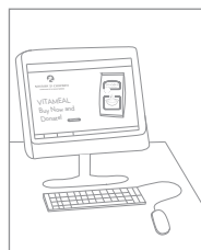
U koopt en doneert voedsel