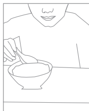
Un bambino malnutrito continua a vivere.