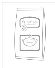
Nu Skin® produit le VitaMeal

En donnant un produit plutôt que de l'argent , les donateurs savent exactement à quoi ils contribuent et ils sont assurés que leur don fait la différence dans la vie des enfants.