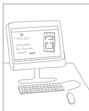
Usted Compra y Dona el Alimento