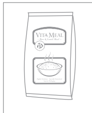
Nu Skin® produziert das VitaMeal

Indem sie ein Produkt anstatt Geld spenden , wissen die VitaMeal Spender genau, wie ihre Spenden verwendet werden, und können sicher sein, dass ihre Spende das Leben eines Kindes verbessert.