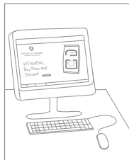
Sie kaufen und spenden die Nahrungsmittel