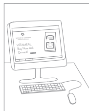
Zakoupíte a darujete stravu